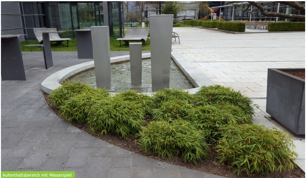
Aufenthaltsbereich mit Wasserspiel