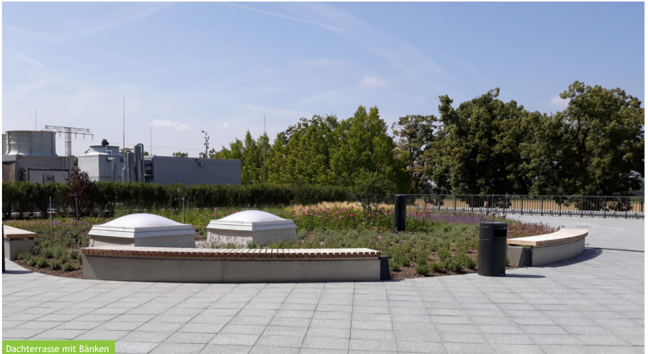
Dachterrasse mit Bänken

Im Zuge der Erweiterung des Instituts für Molekulare Pflanzenphysiologie auf dem Campus des Max-Planck-Instituts in Potsdam-Golm wurden auch die Außenanlagen umgestaltet und erneuert. Die Erschließung wurde neu geplant und zusätzliche hochwertige Aufenthaltsbereiche geschaffen. Der Entwurf sah vor, die bestehenden Strukturen aufzugreifen, vorhandene Elemente weiter zu entwickeln und in die Gestaltung zu integrieren.