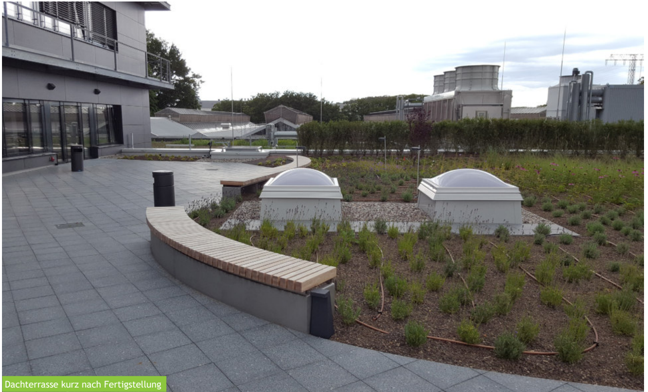
Dachterrasse kurz nach Fertigstellung